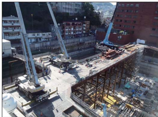
既存南病棟屋上から見た2013年2月末日 工事現場状況