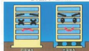
従来の建築物 (耐震構造)

従来の建築物は、地面の上に建物が傾いているが、地震の揺れが地面から直接伝わり建物が大きく揺れます。