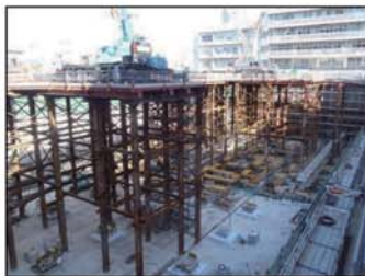
仮設切梁支保工撤去完了状況