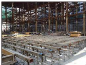
地下2階床躯体工事状況 (リニアック室躯体)