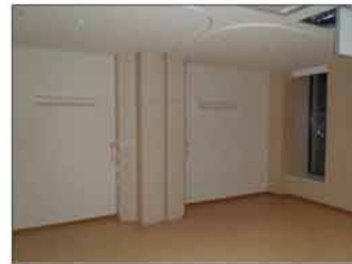
5階 病室(4床室)仕上げ状況