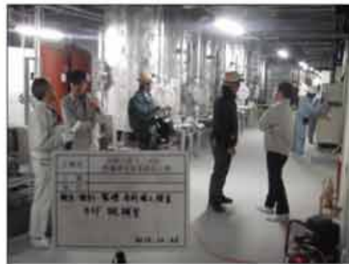
SPC・設計・監理合同完成検査状況