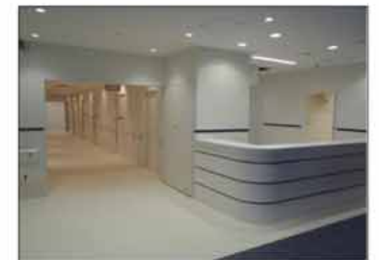
2階生理検査室受付 仕上げ状況