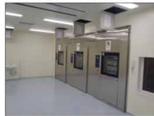
地下1階 組立・減菌室仕上げ状況