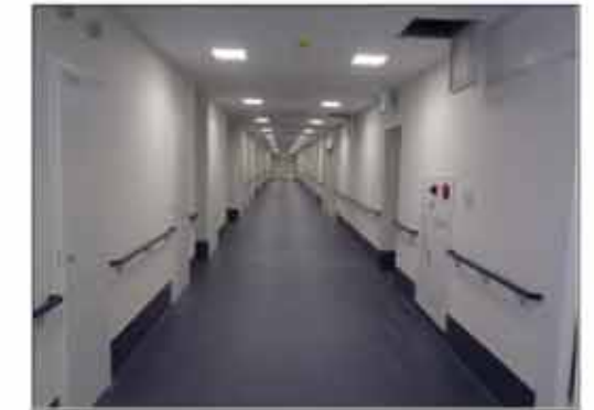
3階ビル外装仕上げ状況