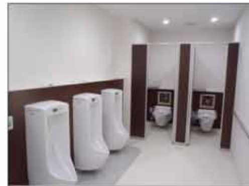
2階外来男性用トイレ 仕上げ状況