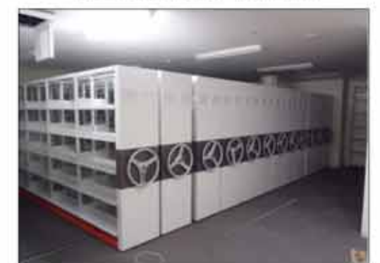
地下1階サーバーセンター 仕上げ状況