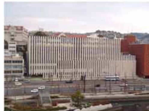
国道側外装仕上げ状況