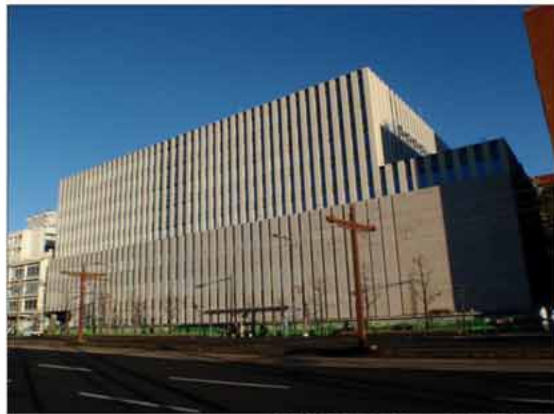
2013年12月末日 工事現場状況