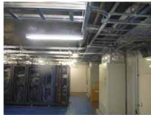
8階サーバー室機器据付状況