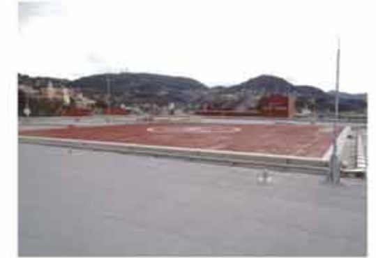
屋上 ヘリポート仕上げ状況